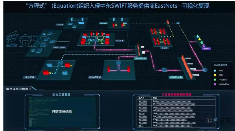
图 安天态势感知平台可视化组件对攻击行动的复现演示

务提供商 EastNets 事件复盘分析报告》,报告精准还原了受到攻击影响的 IT 资产全景和拓扑关系,完整再现了杀伤链的全过程,详尽梳理了行动中使用的武器和作业流程,并以可视化方式予以复现。在报告中,安天在有关专家建议下,以“TCIF 威胁框架”V2 为参考,首次使用威胁框架对超高能力网空威胁行为体攻击行动的各阶段行