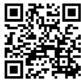
微信扫描二维码可查看报告原文